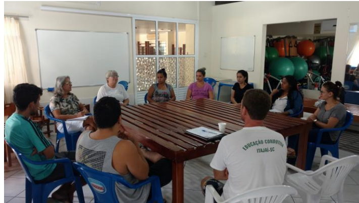
Reunião do Grupo Mães e Bebês

As reuniões de pais do Centro de Educação Conduativa Pássaros de Luz, visam proporcionar conhecimento sobre as dificuldades que os familiares encontram no dia a dia, também oportunizam reflexões sobre os objetivos propostos nos programas da Educação Conduativa e o papel da família para obtenção dos resultados desejados.